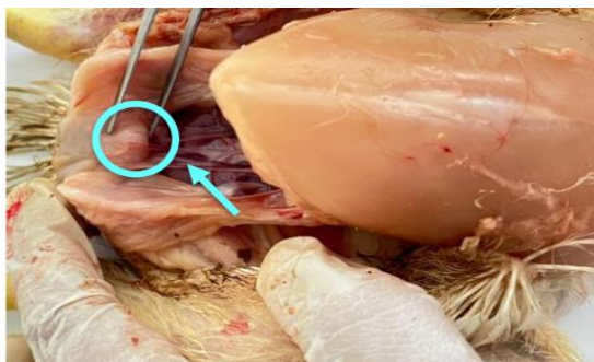
Gambar 1. Posisi in vivo bursa Fabrisius berada di divertikulum dorsal dari proktodeum kloaka ayam pedaging

Hasil pengamatan makroanatomi bursa Fabrisius ayam pedaging pada semua kelompok perlakuan memiliki warna yang khas yaitu putih keruh sampai dengan kuning cerah serta memiliki bentuk cenderung oval dan terletak di sekitar bagian caudal (belakang) dari usus besar, tepatnya di dekat pangkal kloaka. Hal ini sejalan dengan pendapat Konig et al. (2016) yang menyatakan bahwa bursa fabrisius terletak di divertikulum dorsal dari proktodeum kloaka. Pada ayam, bursa ini memiliki bentuk oval dan pipih, cembung di satu sisi dan memiliki ujung yang tumpul (Singh et al. , 2019).