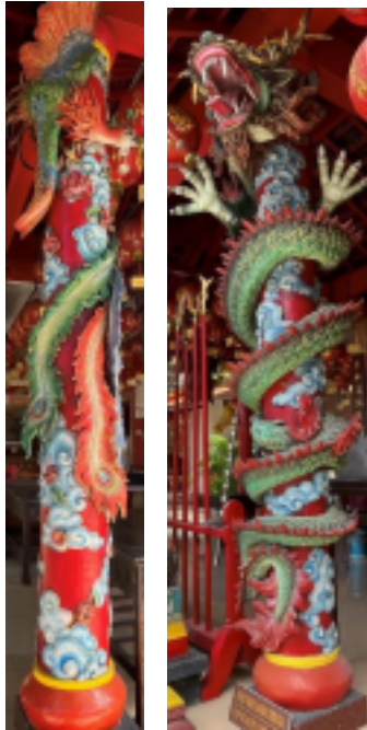
Gambar 7 Tiang Motif Burung Hong dan Tiang Motif Naga

putih yang melambangkan lima unsur kosmik (wu xing) dalam filosofi Tionghoa: air, api, tanah, kayu, dan logam. Bentuk lingkaran menyimbolkan kesempurnaan dan keabadian, sedangkan perpaduan warna tersebut mencerminkan prinsip keseimbangan energi dalam kehidupan dan ibadah.