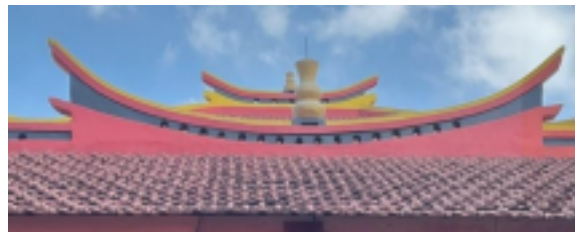
Gambar 2 Atap Utama Kelenteng Leeng Gwan Bio Kuta

Atap utama Kelenteng Leeng Gwan Bio memiliki struktur bertingkat tiga dengan ujung atap melengkung ke atas. Ciri khas ini mencerminkan gaya arsitektur tradisional Tionghoa yang megah dan simetris. Atap ini mengadopsi gaya arsitektur xie shan atau dalam istilah arsitektur dikenal sebagai hip-and-gable roof, yang merupakan salah satu bentuk atap klasik dalam bangunan Tionghoa. Lekukan atap yang mengarah keatas memberikan kesan dinamis sekaligus melambangkan hubungan harmonis antara langit dan bumi. Elemen dekoratif berwarna kuning keemasan pada bagian puncak atap juga berfungsi sebagai simbol perlindungan dan keberuntungan dalam tradisi budaya Tionghoa.