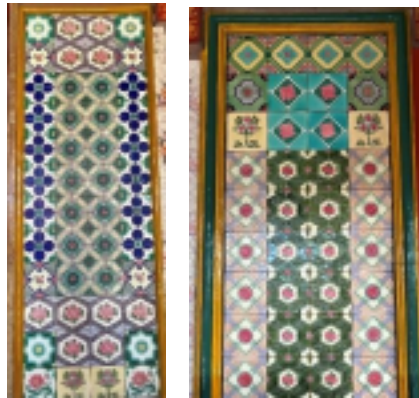
Gambar 4 Ornamen Interior Dinding Keramik (Dokumentasi: Penulis, 2025)

Ornamen pada dinding luar bagian depan Kelenteng Leeng Gwan Bio menampilkan relief tiga dimensi yang menggambarkan lanskap alam lengkap dengan gunung, pepohonan, dan berbagai satwa seperti kuda putih, anjing hutan, kelinci, tikus, ular, harimau, dan ayam jantan. Komposisi relief ini membentuk narasi visual yang sarat simbolisme Tionghoa, mencerminkan harmoni antara makhluk hidup dan alam, serta menggambarkan keseimbangan dalam siklus kehidupan. Setiap hewan memiliki makna simbolik tersendiri, seperti kelinci yang melambangkan kelembutan, tikus sebagai kecerdikan, dan ular sebagai representasi kekuatan serta potensi ancaman, yang keseluruhannya memperkuat nilai-nilai spiritual dan filosofi moral dalam budaya Tionghoa.