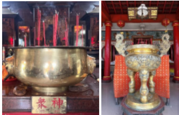
Gambar 8 Hiolo Utama dan Hiolo Umum

Di Kelenteng Leeng Gwan Bio terdapat satu hiolo besar di depan altar utama dan beberapa hiolo kecil di setiap altar pemujaan. Hiolo besar digunakan untuk menancapkan dupa bagi dewa tertinggi (Thian Kong) dan dihias ornamen naga serta motif meander khas Tionghoa yang melambangkan kekuatan kosmis dan penghormatan. Sementara itu, hiolo kecil memiliki desain sederhana tanpa ukiran, hanya diberi label huruf Tionghoa 衆神 (Zhù Shén/Para Dewa) yang menunjukkan fungsinya sebagai media persembahan untuk para dewa atau altar umum.