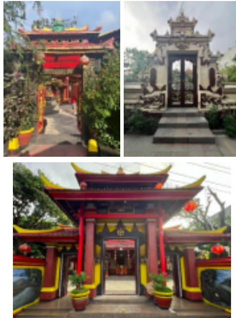
Gambar 5 Gerbang Utama, Gerbang Alternatif, Gerbang Sisi Timur

Gerbang utama Kelenteng Leeng Gwan Bio berbentuk pintu gerbang bertingkat tiga dengan atap pelana bersusun khas Tionghoa model dougong , didominasi warna merah dan emas serta dilengkapi papan nama “Vihara Dharmayana Kuta” sebagai simbol transisi dari dunia luar ke ruang ibadah. Di sisi timur terdapat gerbang alternatif bergaya Tionghoa dengan atap tunggal dan ornamen lotus melambangkan kesucian. Pada sisi bagian utara terdapat gerbang bergaya Bali menyerupai candi bentar, terbuat dari batu padas putih dan dihiasi elemen lokal seperti ratna , teratai , serta kala makara . Ketiga gerbang ini tidak hanya berfungsi sebagai akses, tetapi juga mencerminkan hierarki ruang dan simbol akulturasi budaya Tionghoa-Bali.