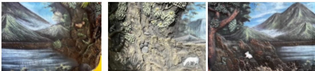
Gambar 3 Relief Dinding Luar Bagian Depan Kelenteng Leeng Gwan Bio Kuta

Atap utama Kelenteng Leeng Gwan Bio memiliki struktur bertingkat tiga dengan ujung atap melengkung ke atas. Ciri khas ini mencerminkan gaya arsitektur tradisional Tionghoa yang megah dan simetris. Atap ini mengadopsi gaya arsitektur xie shan atau dalam istilah arsitektur dikenal sebagai hip-and-gable roof, yang merupakan salah satu bentuk atap klasik dalam bangunan Tionghoa. Lekukan atap yang mengarah keatas memberikan kesan dinamis sekaligus melambangkan hubungan harmonis antara langit dan bumi. Elemen dekoratif berwarna kuning keemasan pada bagian puncak atap juga berfungsi sebagai simbol perlindungan dan keberuntungan dalam tradisi budaya Tionghoa.