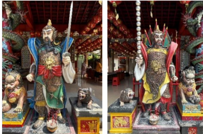
Gambar 10 Patung Dewa Tyn Siok Poo dan Patung Dewa Dei Tie Kiong