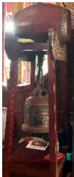
Gambar 12 Lonceng dan Genderang (Dokumentasi: Penulis, 2025)

Pada masing-masing sisi patung dewa penjaga juga dilengkapi dengan patung singa penjaga, yang pada masing-masing alasnya terukir karakter Tionghoa dan angka 1974. Pada sisi kiri, singa penjaga yang biasanya mewakili unsur yin (perempuan) duduk dengan kepala menghadap ke depan, berekspresi ganas, dan kakinya menginjak makhluk kecil, melambangkan pelindung spiritual dan keberuntungan. Sementara di sisi kanan, singa penjaga mewakili unsur yang (laki-laki) yang digambarkan serupa dengan singa kiri namun dengan posisi kaki yang berbeda, yaitu menginjak bola emas bermotif yang melambangkan kekuasaan dan kendali atas dunia atau hukum universal.