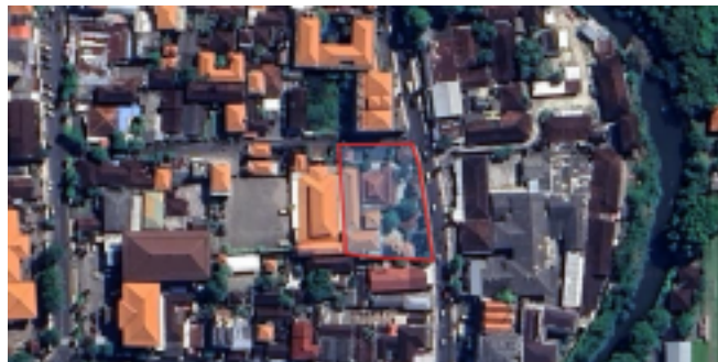
Gambar 1 Lokasi Leeng Gwan Bio Kuta