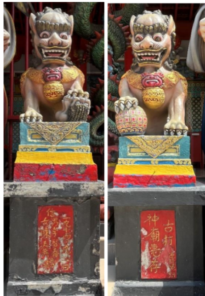
Gambar 11 Patung Singa Penjaga

Terdapat patung penjaga di sisi depan pintu masuk bangunan utama kelenteng. Pada sisi kanan dan kiri pintu masuk utama Kelenteng Leeng Gwan Bio terdapat patung penjaga, yakni Tyn Siok Poo dan Dei Tie Kiong. Patung di sisi kanan adalah Tyn Siok Poo berdiri dengan pedang terangkat dan bola kristal di tangan yang melambangkan perlindungan dan penglihatan spiritual. Tyn Siok Poo digambarkan mengenakan zirah logam serta terdapat ornamen kepala naga pada bagian dada. Pada alas batunya relief yang menunjukkan tahun 1953, yang diduga sebagai tahun penempatan patung di