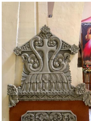
Gambar 8. Ornamen Salib

Ornamen Salib pada gereja terletak pada bagian luar altar. Ornamen salib tersebut menggabungkan simbol Katolik dengan unsur arsitektur Bali, dengan Salib sebagai lambang utama pengorbanan Kristus. Salib pada ornamen ini dikelilingi oleh pepatraan sebagai simbol kesucian dan kehidupan spritual.