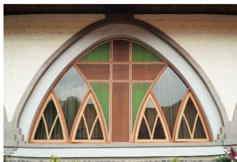
Gambar 6. Kaca Patri

Jendela kaca patri pada Gereja Hati Kudus Yesus Palasari memiliki bentuk seperti salib dengan potongan kaca berwarna merah dan hijau. Kaca patri dalam gereja menurut Siregar (2011) dapat membawa cahaya matahari ke dalam gereja sebagai simbol cahaya iman. Veronica (2008) menyatakan warna merah dalam gereja memberikan kesan semangat dan hijau memberikan kesan ketenangan dan energi positif.