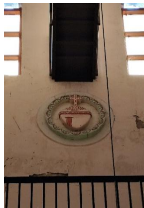
Gambar 7. Ornamen Hati Kudus Yesus

Ornamen Hati Kudus Yesus Palasari pada bagian dalam gereja terletak pada dinding bagian atas. Penempatan ornamen pada bagian atas dinding bertujuan mengarahkan pandangan umat ke atas, ke arah Tuhan. Ornamen ini menampilkan hati yang dikelilingi mahkota duri, api menyala di atasnya, serta luka berdarah di sisi kiri hati, dikelilingi oleh motif floral sederhana. Simbol ini melambangkan kasih abadi Yesus bagi umat manusia, sementara mahkota duri dan luka melambangkan penderitaan-Nya demi penebusan dosa.