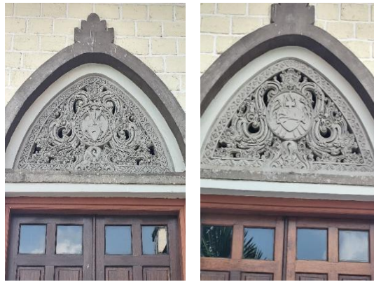
Gambar 5. Ornamen Hati Kudus

Ornamen Hati Kudus pada gereja terletak pada pintu barat dan pintu timur. Pada pintu barat, terdapat ukiran Hati Kudus Yesus yang digambarkan dengan hati terbakar dikelilingi mahkota duri, 3 paku, dan salib yang melambangkan kasih dan pengorbanan Kristus. Pada pintu timur, terdapat simbol hati dengan api dan bunga lili, yang melambangkan Hati Maria Tak Bernoda, simbol kemurnian, kelembutan dan kasih. Kedua ukiran tersebut dihiasi dengan ornamen pepatraan dan sulur bunga padma.