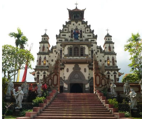
Gambar 2. Candi Bentar

Candi Bentar menurut Muyasyaroh (2015) merupakan bangunan pintu masuk suatu percandian berbentuk candi Jawa Timur yang terbelah menjadi 2. Prihati (2017) menyatakan Gereja Hati Kudus Yesus memiliki 3 buah Candi Bentar yakni 2 pada area depan dan 1 buah pada area tengah halaman. Candi Bentar dalam gereja melambangkan pintu gerbang yang menghubungkan manusia dengan dunia spiritual.