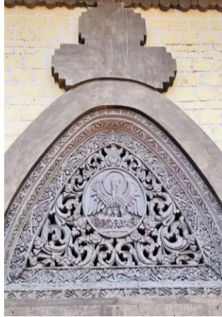
Gambar 3. Ornamen Burung Pelikan

Puniasta pada 2 Mei, ornamen burung pelikan memberi makan anak-anaknya dalam gereja melambangkan pengorbanan Tuhan Yesus dalam menebus dosa umat manusia.