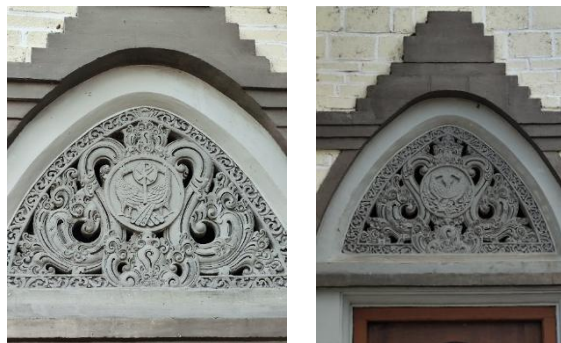
Gambar 4. Ornamen Burung Merpati

Ornamen burung merpati pada Gereja Hati Kudus Yesus Palasari menghiasi pintu utama bagian kanan dan kiri. Pintu bagian kiri terdapat 2 ukiran burung merpati yang mengapit tongkat gembala yang di bagian tengahnya terdapat simbol Chi-Ro. Merpati dalam gereja menurut Mario (2024) merupakan wujud Roh Kudus dalam pelayanan Yesus, sedangkan Chi-Rho menurut Sari (2018) merupakan monogram kuno dari nama Kristus yang digunakan oleh Kaisar Konstantinus. Di pintu kanan gereja juga terdapat ukiran 2 burung merpati yang mengapit cawan yang merupakan simbol Ekaristi yang merujuk pada darah Kristus dan Perjamuan Terakhir. Selain itu juga terdapat hosti sebagai lambang tubuh kristus dan pengorbanan-Nya demi menebus dosa manusia.