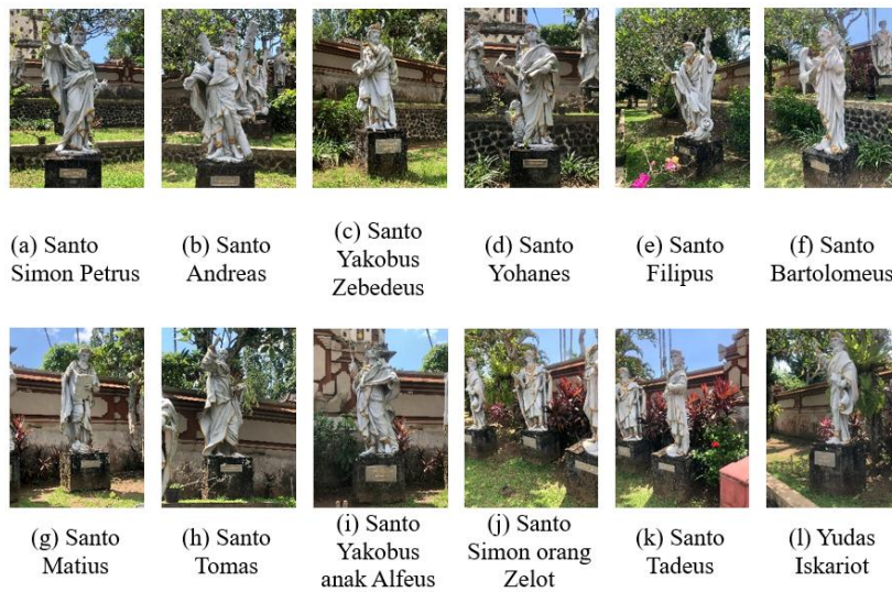
Gambar 1. Patung 12 Murid Yesus