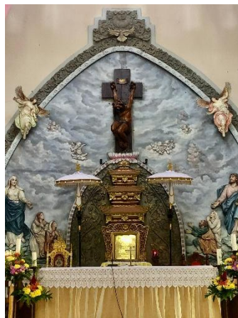
Gambar 9. Lukisan Altar

Lukisan pada bagian belakang altar Gereja Hati Kudus Yesus Palasari menggambarkan peristiwa wafatnya Yesus di Kayu salib, dengan langit yang gelap sesuai dengan narasi pada Injil Matius 27-45. Salib Kristus sebagai pusat altar berdasarkan hasil wawancara dengan Bapak Wayan Puniastha ditampilkan dengan gaya khas pemahat Hindu, menggambarkan tubuh Yesus yang tergantung dan tertunduk. Pada bagian atas altar terdapat burung merpati dan dua malaikat sebagai simbol Roh Kudus dan saksi iman. Tabernakel pada bagian bawah salib dihiasi dengan buah anggur, burung pelikan bewarna emas, yang melambangkan darah dan pengorbanan Kristus.