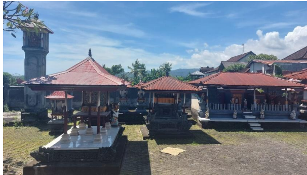
Gambar 1. Pura Luhur Dadia Kawitan Pasek Gelgel Kamasan Desa Sawan

amanah untuk menjadi Pengempon Pura Luhur Dadia sudah membawa dan menjaga prasasti tersebut kemanapun mereka pergi hingga akhirnya menetap di Desa Sawan.