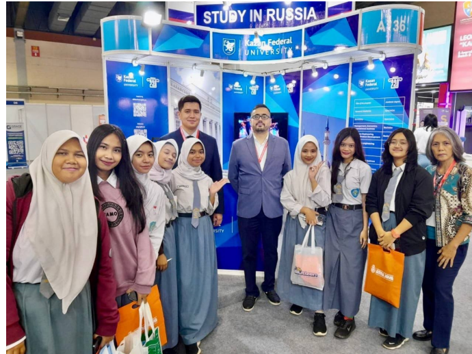
Gambar 2. Perwakilan Universitas Federal Kazan (UFK) dan alumni UFK bersama pengunjung Pameran Pendidikan Internasional ke-32 di Jakarta

juga menekankan peran lulusan universitas Rusia dalam mempromosikan pendidikan tinggi Rusia di Indonesia.